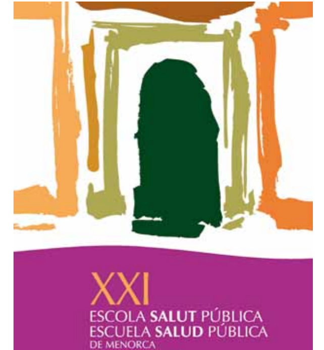
Cartell de la vint-i-una edició de l'Escola de Salut Pública.

los Pacientes i s'ha presentat la Guía para incorporar la perspectiva de género a la investigación en salud impulsada per l'Observatori de Salut de les Dones del Ministeri de Sanitat i Política Social.