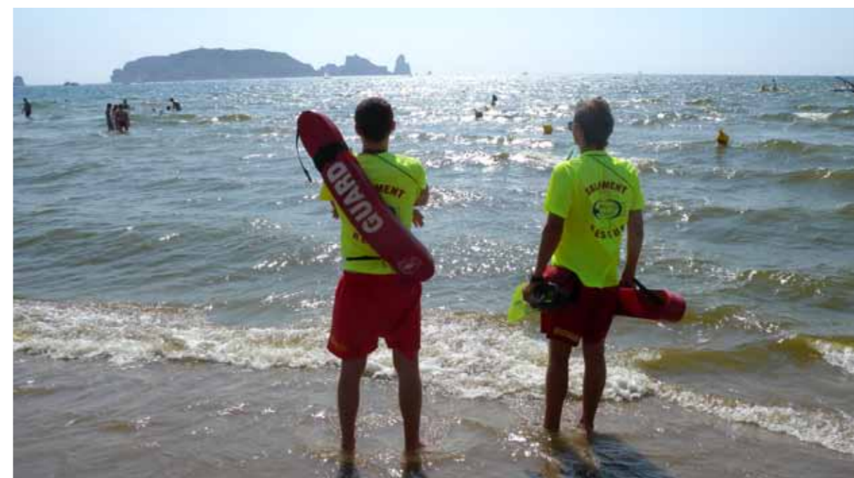
Treballadors del servei de vigilància, salvament i socorrisme a la Platja Gran de l'Estartit, Torroella de Montgrí.

Aquest 2010 el programa de suport econòmic per a la seguretat a les platges té un pressupost total de 355.000 euros, i l'han sol·licitat 20 municipis del litoral gironí per a un total de 99 platges.