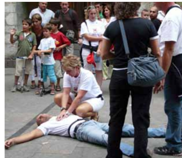
Simulacre de reanimació cardiopulmonar realitzat a Girona el mes d'agost durant la visita a la ciutat dels impulsors de la implantació de desfibril·ladors a Piacenza, Itàlia.

"Els desfibril·ladors s'implantaràn arreu de les comarques gironines, en carrers, places, equipaments d'ús públic i espais amb una important aflluència de persones"