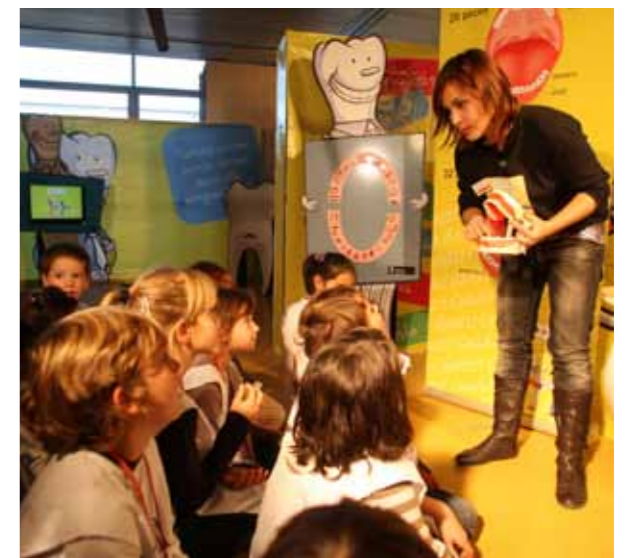
Exposició "Cuida't les dents" a Girona (fotografia: Pere Duran / Arxiu de Dipsalut).

Els ajuntaments de la demarcació de Girona adherits al Catàleg de Serveis de Dipsalut poden sol·licitar l'exposició "Cuida't les dents".