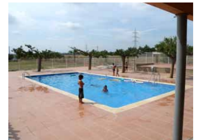
Piscina de Borrassà.

Dipsalut també ofereix cursos de formació a les persones encarregades del manteniment d'aquestes instal·lacions.