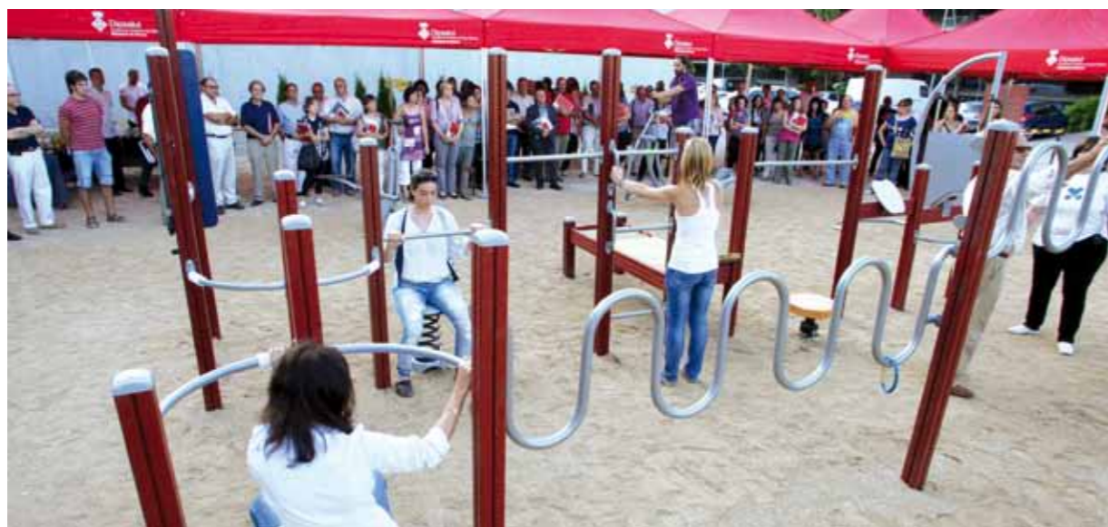
Sessió de dinamització realitzada el dia 5 de juliol al prototip de Parc Urbà de Salut instal·lat davant la seu de Dipsalut.

Dipsalut ha presentat els Parcs Urbans de Salut i les Xarxes d'Itineraris Saludables. En l'acte, celebrat el mes de juliol passat, s'hi va mostrar el prototip de Parc Urbà de Salut que s'instal·larà arreu de les comarques gironines i es va fer una sessió de dinamització per explicar la funció de cada aparell i quins beneficis comporta l'ús regular d'aquests equipaments. També es van poder veure mostres de la senyalització unitària de les Xarxes d'Itineraris Saludables.