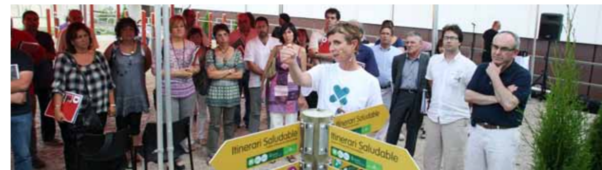
Presentació de les Xarxes d'Itineraris Saludables davant la seu de Dipsalut.

Dipsalut segueix les recomanacions de l'Organització Mundial de la Salut, que marca entre 30 i 60 minuts d'activitat física moderada diària. En el cas dels infants i joves, es recomanen 60 minuts d'activitat física moderada i fer esport. Es considera "activitat física" qualsevol moviment corporal que provoca d'un desgast d'energia. Inclou una gran varietat de pràctiques quotidianes, de treball i d'oci de diversa intensitat, com pujar escales, anar amb bicicleta o desplaçar-se a peu. L'exercici físic és l'activitat física planificada, estructurada i repetitiva que té per objectiu la millora o manteniment de la forma o capacitats físiques.