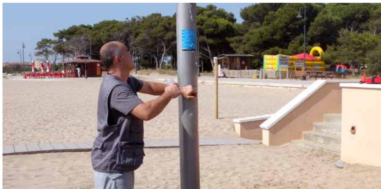
Un tècnic de CECAM, empresa proveïdora de Dipsalut, pren una mostra de l'aigua d'una de les dutxes a la Platja Gran de l'Estartit, Torroella de Montgrí (fotografia: Arxiu de Dipsalut).

Dipsalut ha revisat 61 platges de 18 municipis gironins. Ha analitzat mostres de la sorra per determinar si calia millorar-ne la neteja. També ha controlat l'aigua de totes les dutxes i rentapeus per descartar que tinguessin legionel·la. En total s'han inspeccionat 312 instal·lacions. L'organisme de salut pública de la Diputació de Girona ofereix un segon programa en relació a les platges: el d'ajuda econòmica per als operatius de vigilància, salvament i socorrisme. L'han sol·licitat 20 municipis del litoral gironí per a les seves 99 platges.