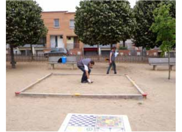
Tècnics de Cecam (proveïdor de Dipsalut) revisant una sorra d'un parc infantil a Vidreres.

El més habitual és que es proposi canviar la sorra, passar-hi el rasclat regularment per oxigenar-la i facilitar que hi incideixi la llum del sol (els raigs ultraviolats tenen capacitat desinfectant), retirar les restes vegetals o orgàniques, definir una periodicitat adequada per a les tasques de neteja de la sorra i procurar que tant a la zona de joc dels menuts com en l'entorn del parc o del centre educatiu es dificulti al màxim l'accés d'animals. En alguns casos també es recomana un canvi del tipus de sorra ja que n'hi ha que retenir més la humitat que d'altres, i això facilita la presència de microorganismes (les de gra gruixut són més recomanables ja que dificulten la retenció d'humitat).