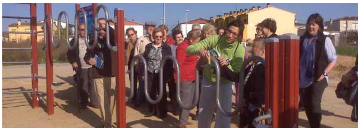
Una de les sessions de dinamització celebrada al Parc Urbà de Salut de Riudellots de la Selva

L'any 2011 ha estat el de consolidació de Dipsalut. La totalitat dels municipis gironins, els 221, estan adherits al Catàleg de Serveis de l'Organisme i compten, doncs, amb la seva oferta de programes i serveis. Això vol dir que Dipsalut està incidint en la salut de més de 752.000 persones i sobre un territori d'aproximadament 5.800 quilòmetres quadrats.