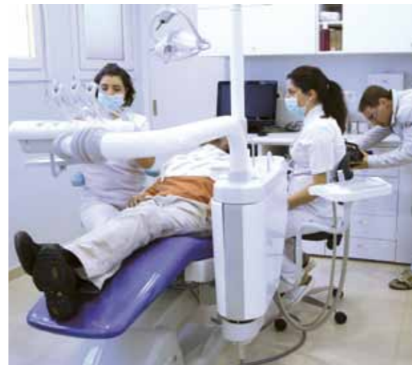
Clínica de Dentistes Solidaris a Girona