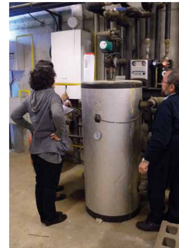
Revisió d'instal·lacions del municipi d'Aiguaviva en el marc del programa de suport a la gestió i control d'instal·lacions amb alt risc de transmissió de legionel·losi.