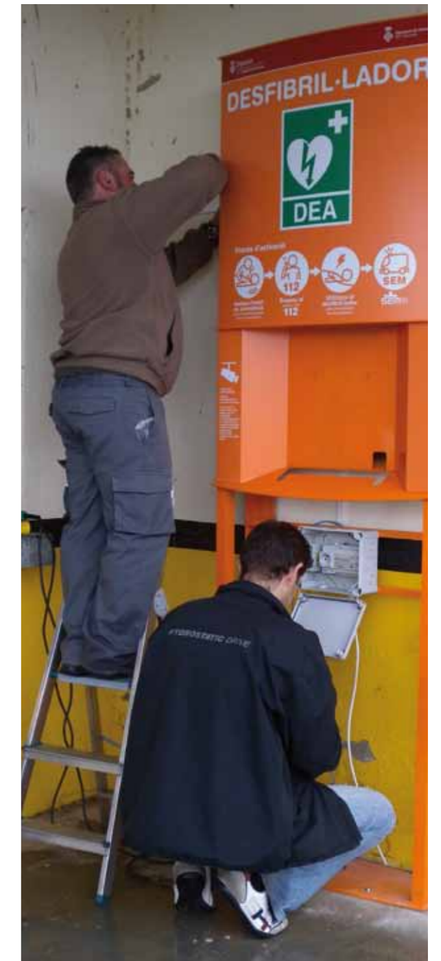
Instal·lació d'un dels desfibril·ladors fixos de Llers, duta a terme el 22 de novembre de 2011.