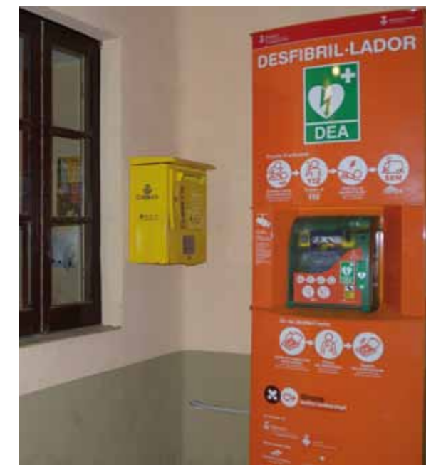
“Desfibril·lador instal·lat al Centre Cívic El Club de Sant Miquel de Fluvià”