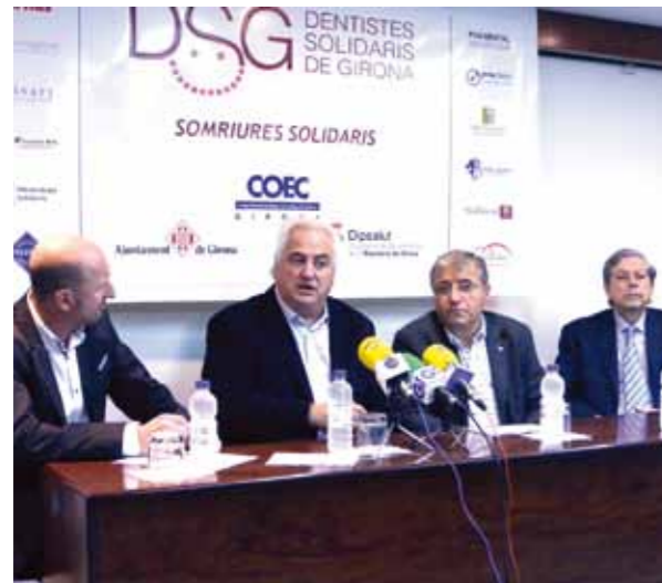
Presentació del programa "Somriures Solidaris"

La iniciativa vol ser un complement a les accions en salut bucodental que ja es realitzen des de les administracions públiques.