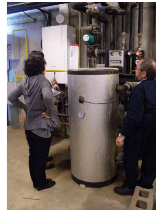
Revisió d'instal·lacions del municipi d'Aiguaviva en el marc del programa de suport a la gestió i control d'instal·lacions amb alt risc de transmissió de legionel·losi.