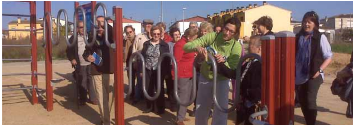
Una de les sessions de dinamització celebrada al Parc Urbà de Salut de Riudellots de la Selva

L'any 2011 ha estat el de consolidació de Dipsalut. La totalitat dels municipis gironins, els 221, estan adherits al Catàleg de Serveis de l'Organisme i compten, doncs, amb la seva oferta de programes i serveis. Això vol dir que Dipsalut està incidint en la salut de més de 752.000 persones i sobre un territori d'aproximadament 5.800 quilòmetres quadrats.