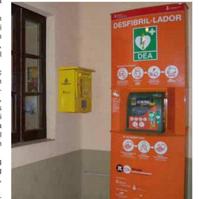
“Desfibril·lador instal·lat al Centre Cívic El Club de Sant Miquel de Fluvià”