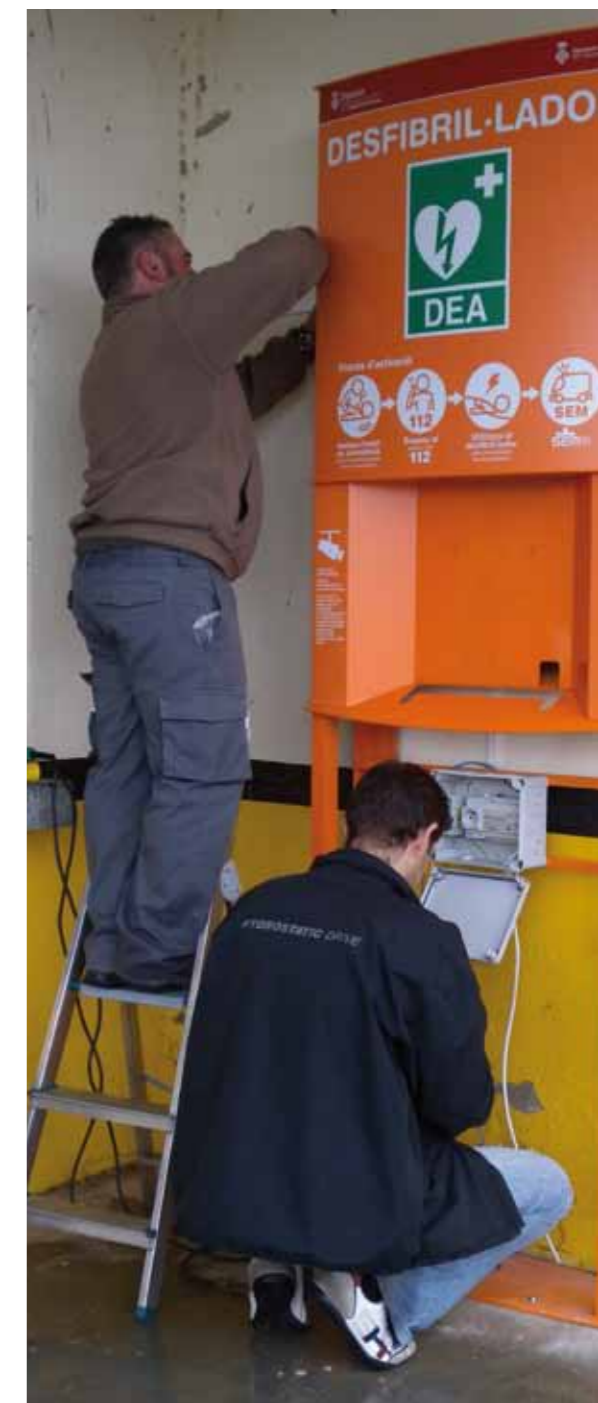
Instal·lació d'un dels desfibril·ladors fixos de Llers, duta a terme el 22 de novembre de 2011.