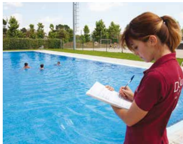
Presa de mostres d'aigua a la piscina municipal de Fornells de la Selva.

L'aplicació d'aquests programes en els últims anys ha permès una millora progressiva en les condicions de seguretat i salubritat de les piscines de la demarcació. L'any 2013, el 95 % de les 646 piscines avaluades tenien un bon nivell de qualitat, és a dir, no presentaven deficiències que poguessin suposar un risc per a la salut dels usuaris.