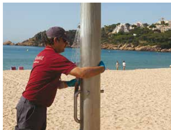
Neteja i desinfecció inicial de les dutxes i rentapeus de les platges de Sant Feliu de Guixols.

Els anys anteriors, els resultats han evidenciat, en general, un alt nivell de salubritat de les platges gironines. Totes les dutxes i rentapeus s'han mantingut lliures de legionel·la, i majoritàriament en bon estat sanitari. Pel que fa a la sorra, només una petita part de les mostres presentava alguna deficiència. Bàsicament, es van trobar restes fecals per contaminació creuada.