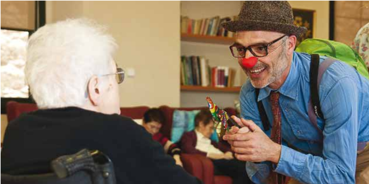
Les joguines antigues són una bona manera de connectar amb els avis.

moviment dels ulls o els sons que emeten ens diuen si ho estem aconseguint».