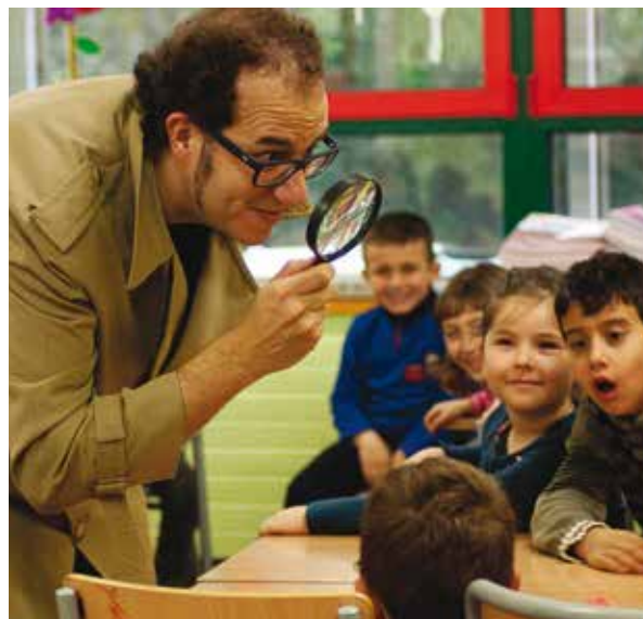
Actuació del Detectiu Queixal Corcat a l'escola L'Aulet de Celrà. Autora: Joanna Magureanu.

Una de les moltes conseqüències que ha comportat l'impacte de la crisi econòmica en la nostra societat ha estat el canvi en la concepció de l'Estat central envers el món local, en passar d'una posició de respecte a l'autonomia local i de descentralització de les seves competències a un major control de totes les esferes administratives per contenir la despesa pública. Una translació pràctica d'aquest control sobre l'activitat municipal és la Llei 27/2013, de 27 de desembre, de racionalització i sostenibilitat de l'Administració local (LRSAL). Aquesta llei –al marge de la forta contestació política des del món local– és de complexa aplicació i subjecta a canvis dependent del seu desplegament reglamentari. A continuació, fem una primera aproximació als canvis que –preveiem– anirà desencadenant respecte de les competències municipals en l'àmbit concret de la salut pública i, especialment, la promoció de la salut.