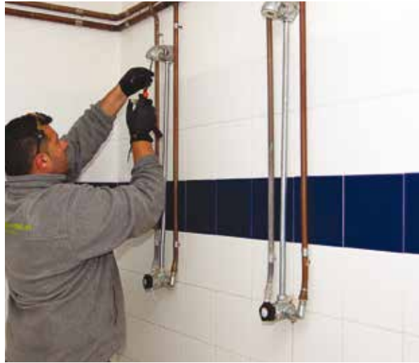
Acció de control duta a terme al poliesportiu d'Anglès en el marc dels programes de suport a la gestió i control de les instal·lacions amb risc de transmissió de legionel·losi.

El desenvolupament d'aquests programes consisteix en el disseny i implantació de plans de manteniment, desinfecció i control analític per a les instal·lacions municipals de risc. Periòdicament, Dipsalut les revisa, en fa la neteja i desinfecció preventiva, recull mostres i les analitza per determinar si hi ha el bacteri. En cas que es detecti legionel·la, es comunica immediatament a l'ajuntament afectat i es fa una desinfecció general. Posteriorment es comprova, amb una nova analítica, que s'ha eliminat el bacteri i es donen totes les instruccions necessàries per tal que la situació no es repeteixi, com ara millorar les accions de manteniment i control o fer reformes estructurals en els sistemes d'aigua.