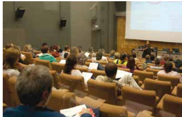
Imatge de la sessió informativa.

El programa ha de servir, principalment, per facilitar l'aprenentatge de les deu habilitats bàsiques per a la vida i promoure estils de vida saludables donant eines a l'alumnat, als docents i a les famílies per avançar en aquesta direcció. Es començarà a desenvolupar durant el curs 2014-2015 en aquells centres educatius que l'hagin sol·licitat a través del seu ajuntament.