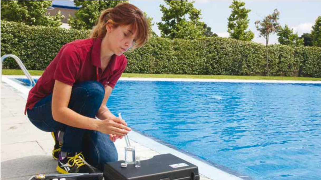
Presa de mostres d'aigua a la piscina municipal de Fornells de la Selva.

Dipsalut avalua 721 piscines d'ús públic (75 més que el 2013) de 130 municipis de la demarcació. L'Organisme n'analitza les condicions higièniques i arquitectòniques per tal de garantir que són segures per a la salut de les persones. També forma els responsables d'aquests equipaments i les persones que s'encarreguen directament del seu manteniment. Ho fa dins dels programes d'Avaluació higiènica i sanitària de les piscines d'ús públic i el de Suport a la gestió del risc derivat de les piscines d'ús públic de titularitat i/o gestió municipal.