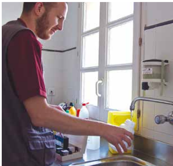
Actuació de control de l'aigua d'aixeta duta a terme a un centre escolar de Mont-ras.