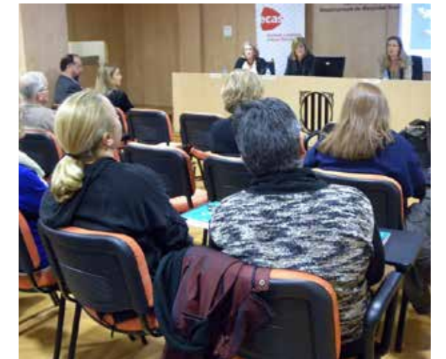
Presentació de la Guia d'Entitats d'Acció Social a Girona

L'objectiu principal del recurs és promoure la col·laboració entre l'administració local i les organitzacions sense ànim de lucre a l'hora de desenvolupar projectes i de crear i gestionar serveis de l'àmbit de l'acció social. Per aquest motiu, la publicació, s'està difonent entre els ajuntaments i altres ens locals de les comarques gironines. S'ha editat en paper i també s'ha penjat a la