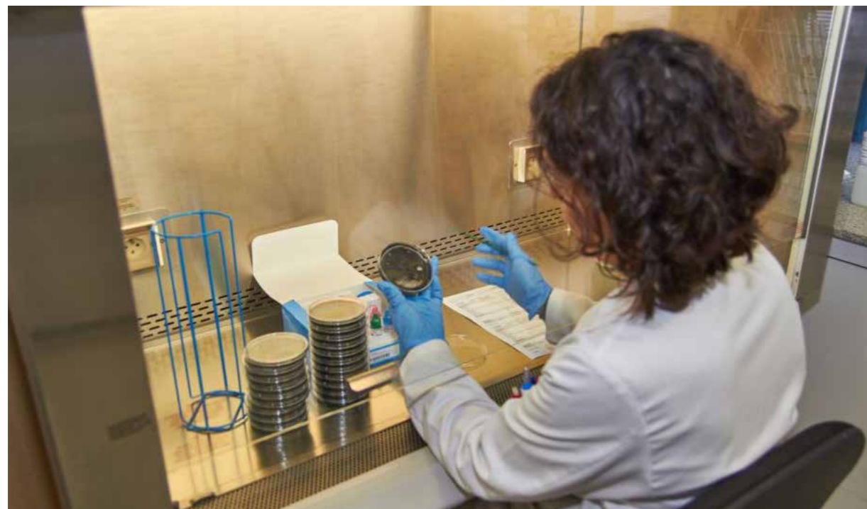
Control analític per detectar o descartar la presència de legionel·la

La millor forma de prevenir la legionel·losi és controlar les instal·lacions on pot proliferar el bacteri (sobretot els sistemes d'aigua calenta sanitària i les torres de refrigeració). Dipsalut i els ajuntaments gironins ho fan. Periòdicament es duen a terme desinfeccions, controls analítics i actuacions per reduir els factors de risc en aquelles instal·lacions on podria proliferar el bacteri.