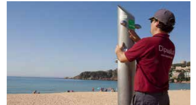
Una de les accions vinculades al programa de Suport a la Gestió de la Salubritat a les Platges

La tercera gran acció del programa de gestió del risc de les platges és la revisió de la sorra. Se'n prenen mostres periòdicament i en diferents punts i s'analitzen. Si es detecta concentracions destacables de microorganismes o fongs (que podrien comportar