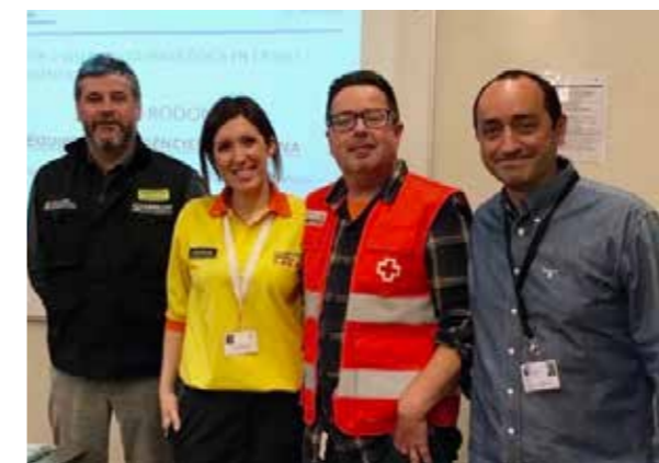
Representants dels quatre serveis d'emergències psicològiques que actuen a la demarcació

Aquests equips són el del Col·legi Oficial de Psicologia, el del Sistema d'Emergències Mèdiques (SEM), el de Creu Roja i el de Dipsalut.